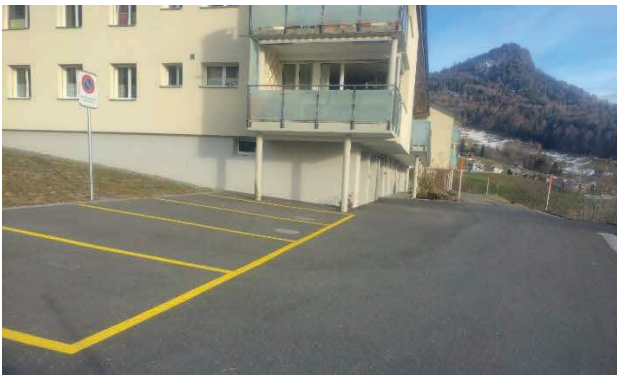
Aussenparkplätze beim MFH Sittli

erstellen. Gleichzeitig haben wir die alte Klärgrube zurückgebaut und die Kanalisation erneuert.