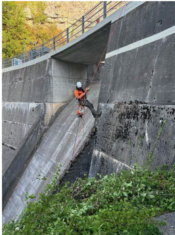
Holzereiarbeiten an der Stauseemauer Muslen

Zu unserem breiten Tätigkeitsfeld gehören der jährliche Unterhalt der Schutznetze an der Hauptstrasse Amden-Weesen und Betliserstrasse, direkt ausgeführt von unserer Forstgruppe, sowie Sanierungen oder Ersatz der Lawinverbauungen am Mattstogg, Gartenholzereien und die Betreuung der Holzschntzelheizung.