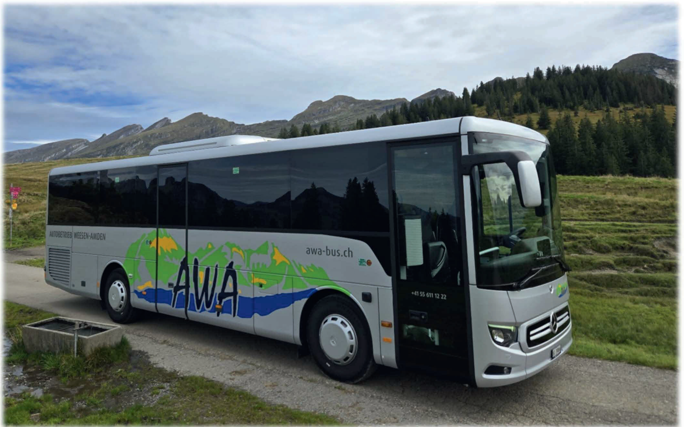
Mercedes-Benz Intouro K (Reisecar) auf der Vorder Höhi mit Churfirnen im Hintergrund.