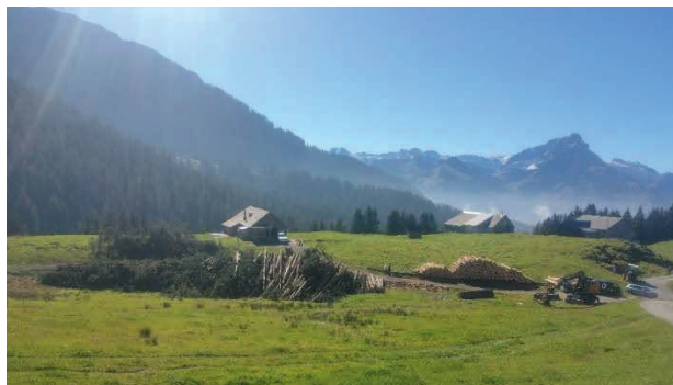
Holzlagerplatz im Altschen

Im Schutzwald wurden drei Holzschläge ausgeführt: 140 m 3 im unteren Bannwald, 50 m 3 im Talegg und 100 m 3 im Hotteie. Im Sonderwaldreservat wurden fünf Holzschläge ausgeführt: in den Gebieten Hinter dem Brunnen 350 m 3 , Beerwald 930 m 3 , Breitriet 600 m 3 , Vorderstei und Stöckli 480 m 3 , sowie Arschwald 180 m 3 .