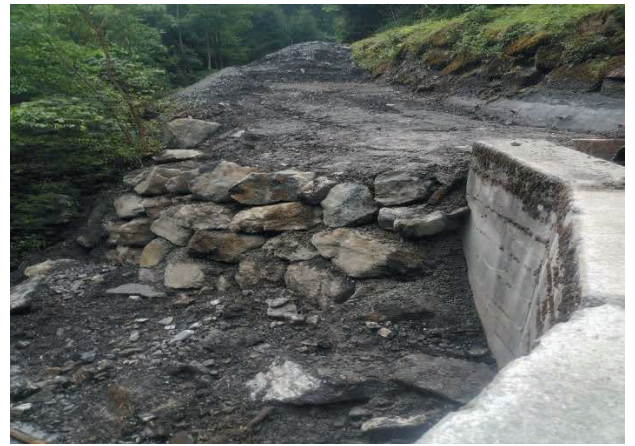
Neue Stützmauer im Tschellis