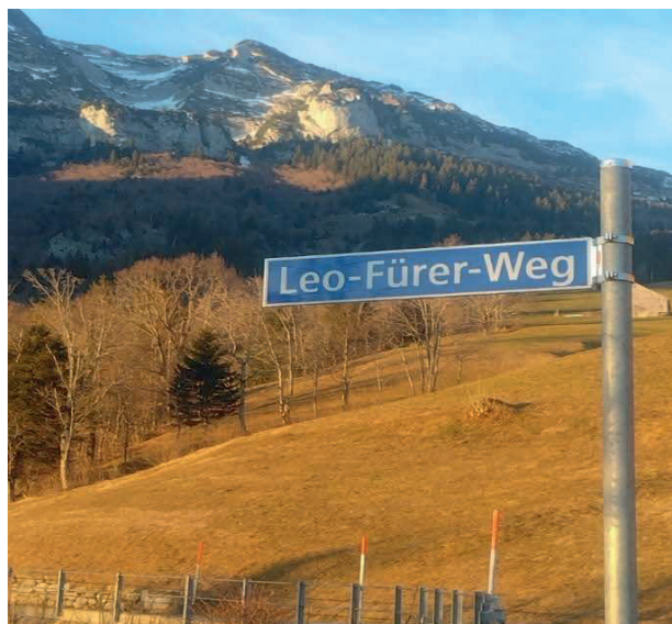
Umbenannter Weg über den Rombach