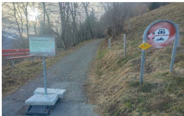
Fahrverbotstafel Eingangs Schafbettstrasse

Im Frühling wurde festgestellt, dass die südseitige Naturstützmauer an zwei Stellen ihre Funktion nicht mehr erfüllt und einzustürzen droht. Die Gemeinde erliess daraufhin ein Fahrverbot. In der Zwischenzeit wurde ein Perimeter für diesen Strassenabschnitt erstellt, der noch nicht rechtskräftig ist. Ebenfalls wurde abgeklärt, ob es allenfalls Beiträge an die Sanierung gibt: Die Schadenssumme ist leider zu klein, damit es für die Sanierung Beiträge vom Kanton gibt. In Absprache mit dem anliegenden Grundeigentümer wurden für die Sanierung Offerten eingeholt. Die Arbeiten werden voraussichtlich diesen Frühling 2026 ausgeführt.