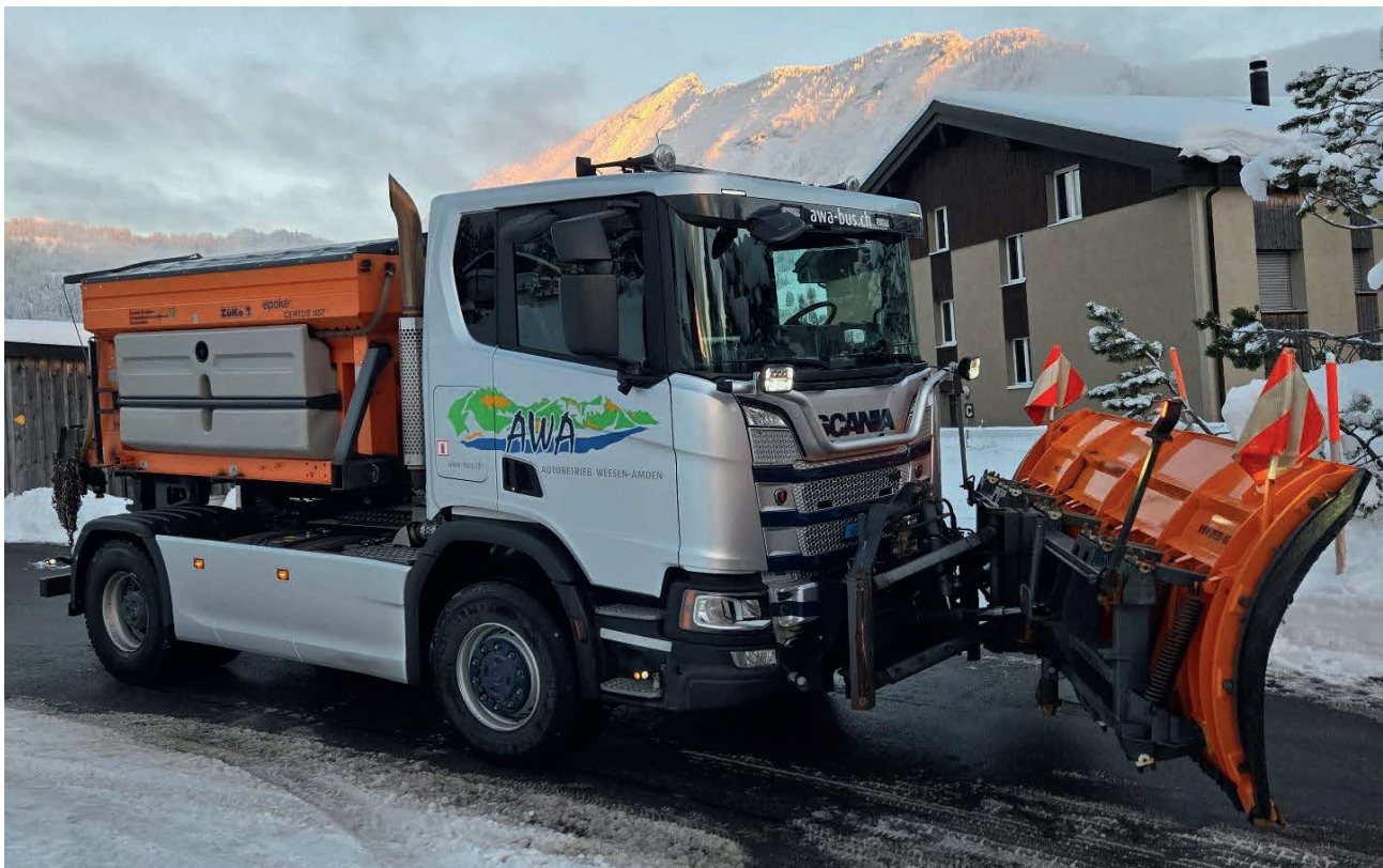
Scania im Winterdienst mit Leistchamm im Hintergrund.