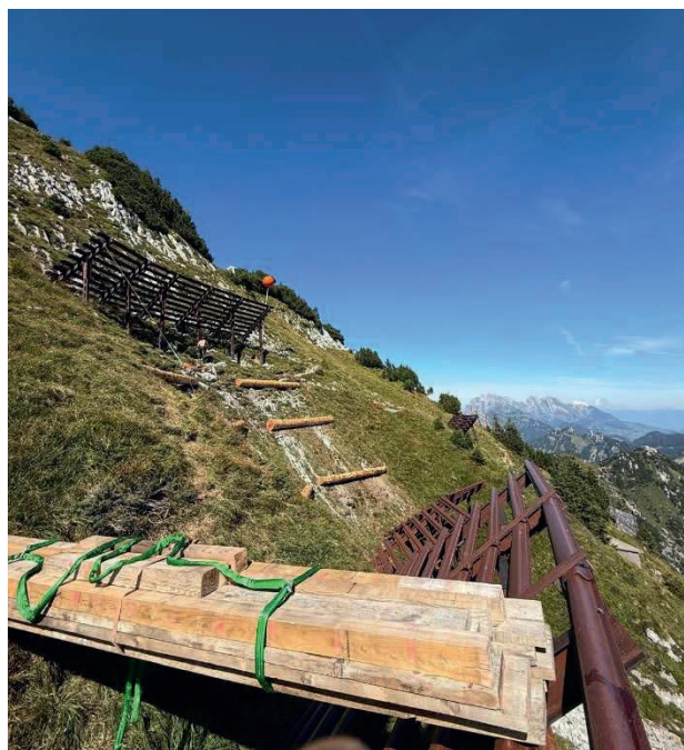
Arbeiten an der Lawinverbauung Mattstogg