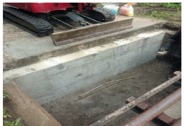
Neues Auflager für den Weiderost

An der Vorderhöhistrasse wurde der Weiderost im Langenegg neu gesetzt.