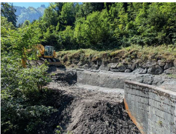
Vorbereitungsarbeiten im Tschellis

Die Arbeiten konnten ausgeführt werden. Zuerst musste die Rückwand mit Netz und Nägel gesichert werden, anschliessend konnte die Stützmauer wieder aufgebaut werden.