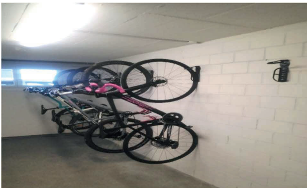
Viel Platz für Velos

Im Mehrfamilienhaus Hag wurden diverse kleinere Arbeiten ausgeführt, u.a. Anpassungen im Keller, Velo- und Skiraum.