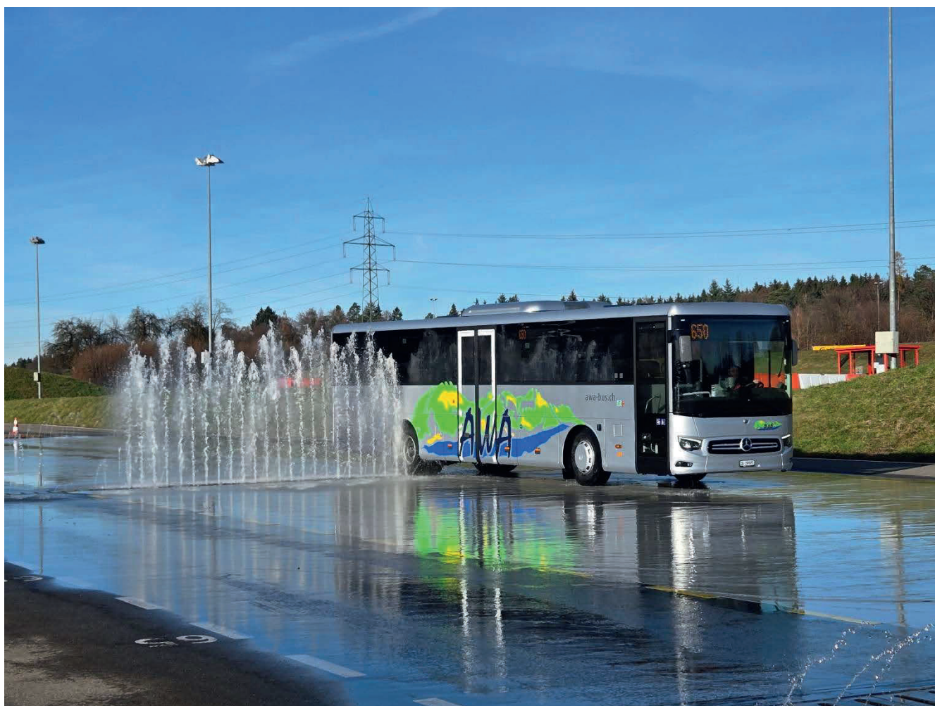
Fahrerweiterbildung (Schleuderkurs) in Hinwil