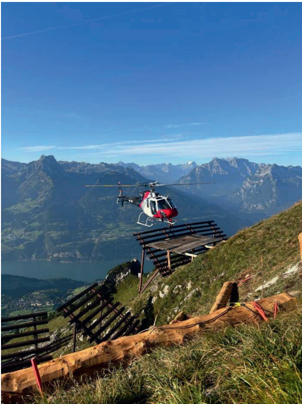
Arbeiten an der Lawinverbauung Mattstogg