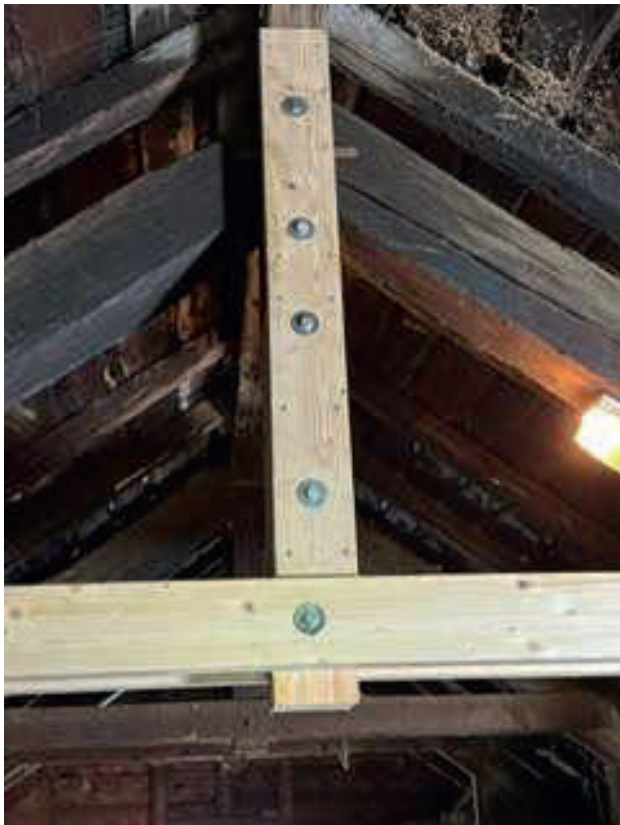
Neue Abstützung Dachbalken

Alljährlich führt die Ortsgemeinde Zaunarbeiten auf den Alpen Hinterberg und Vorderberg in der Länge von rund 23 km aus. Den Zäunern ein herzliches Dankeschön für ihre Arbeit.